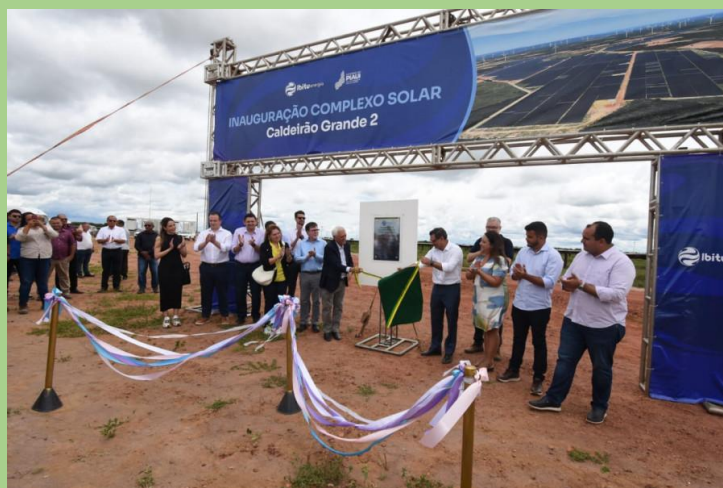
Presença na inauguração do Complexo Solar Caldeirão Grande 2.

Vice-Governadoria terá nova sede em prédio que será revitalizado no Centro de Teresina - Iniciativa do Vice-Governador juntamente com a secretária de Desenvolvimento, Abastecimento e Energias Renováveis é de recuperar o prédio ocupação por outras secretárias também, visando revitalizar o Centro da capital.