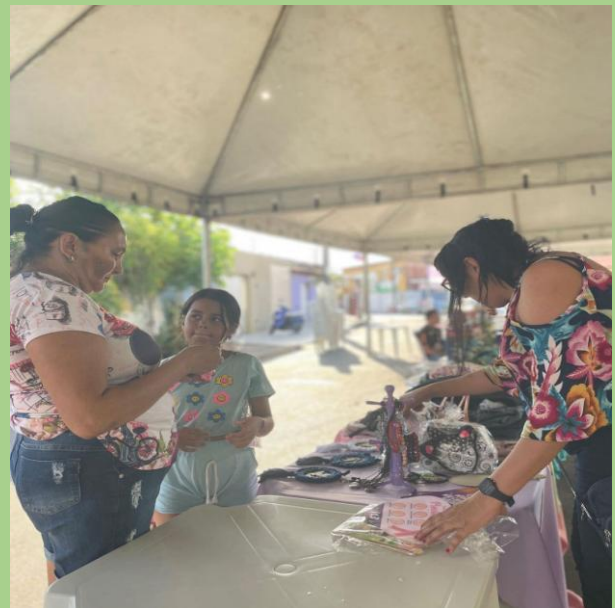
Incentivo ao artesanato com exposição de peças