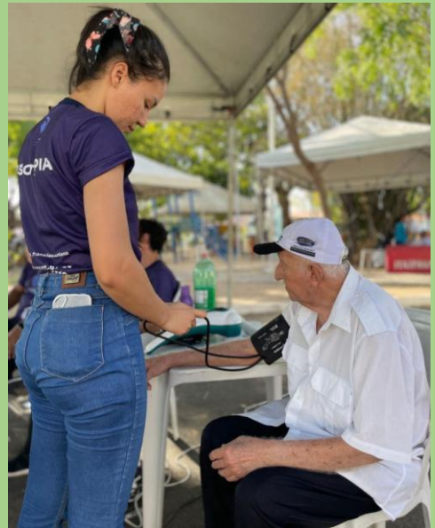
Serviços de saúde da população