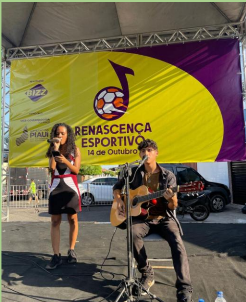
Incentivo e apoio a músicos populares